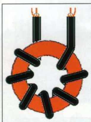
5 - Self d'arrêt sur tore ferrite.