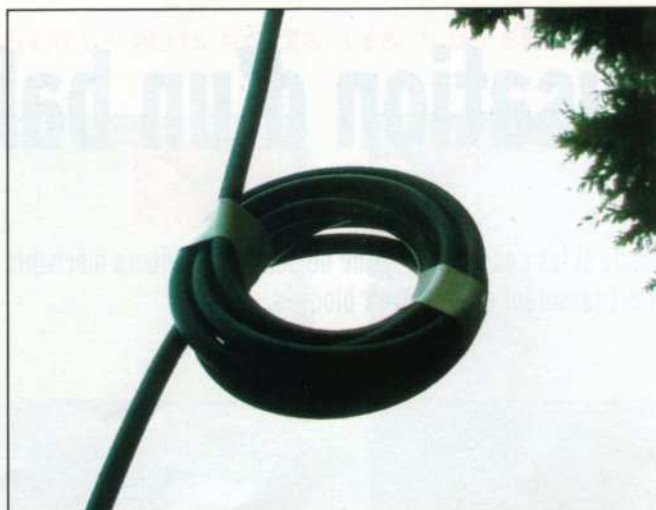
4 - Self d'arrêt pour courants de gaine en câble coaxial.

Si on torsade ensemble deux fils émaillés, on obtient une ligne bifilaire torsadée, ça semble évident. Pour ce faire, je